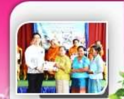
ปราชญ์ชุมชน กลุ่มครัวข้างบ้าน บ้านหนองปลาเชิง หมู่ที่ ๑ ชุมชน ๒