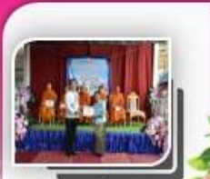
ปราชญ์ชุมชน