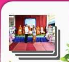
ปรากษณ้ช้มนคน นางเพลีนพิต ซาส้าโรง