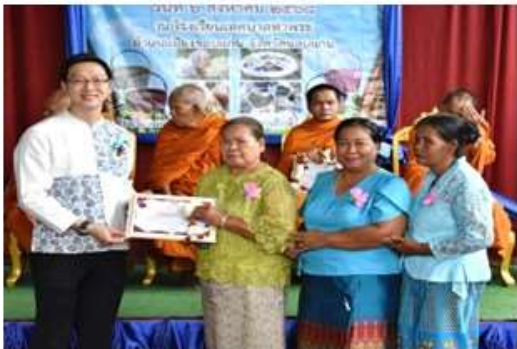
กลุ่มครัวช่างบ้าน ครูภูมิปัญญาปราชญ์ชุมชน สาขาโภชนาการอาหาร/ขนม/เบเกอรี่และเครื่องดื่ม