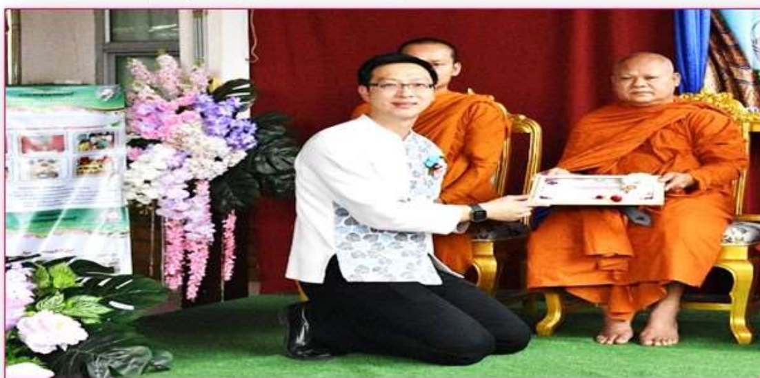
พระครูวิฑูรย์ธรรม ผู้ทรงคุณวุฒิด้านปราชญ์ชุมชน อาษา ปรัชญา ศิวะมา และประเพณี