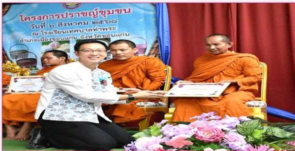
พระพรพิทักษ์ ปภาโส ผู้ทรงคุณวุฒิด้านปราชญ์ชุมชน อาษาปรัชญา ศีลธัมมา และประเพณี