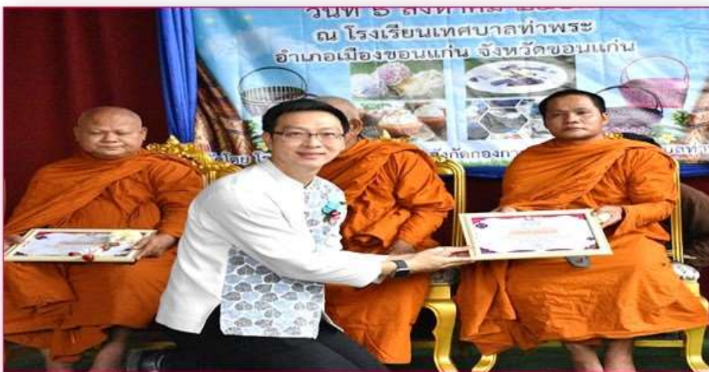
พระครูสังฆรักษ์ธเนศ อภิเศกบุญไชย ผู้ทรงคุณวุฒิด้านปราชญ์ชุมชน อาษา ปรัชญา ตี้อริมา และประเพณีย์