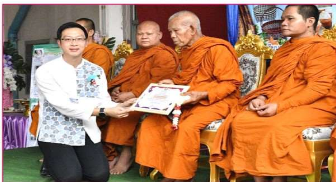
พระราชประสิทธิ์วิฑูรย์ ผู้ทรงคุณวุฒิด้านปราชญ์ชุมชน อาษา ปรัชญา ศิวะมา และประเพณี