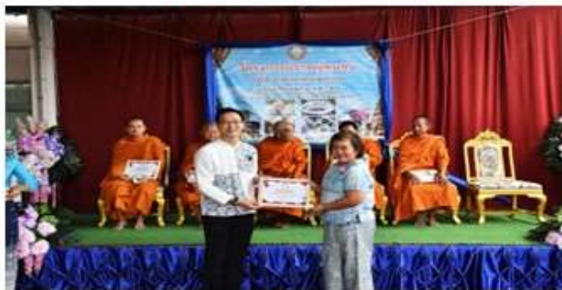
บริษัท ซีพีแรม จำกัด (ขอนแก่น) ผู้ทรงคุณวุฒิด้านบรรเทาทุกข์ผู้ประสบภัย อาสาโภชนาการอาหาร/ขนม/เบเกอรี่และเครื่องดื่ม