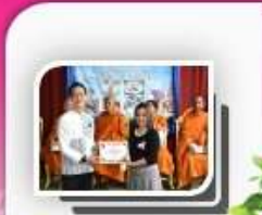
ปราชญ์ชุมชน