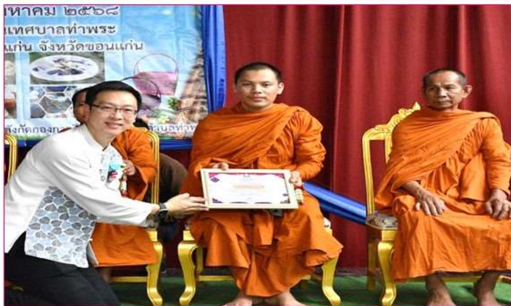
พระมหาธรรพวงค์ ธมฺมวราที ผู้ทรงคุณวุฒิด้านปราชญ์ชุมชน อาษาปรัชญา ศีลธัมมา และประเพณี